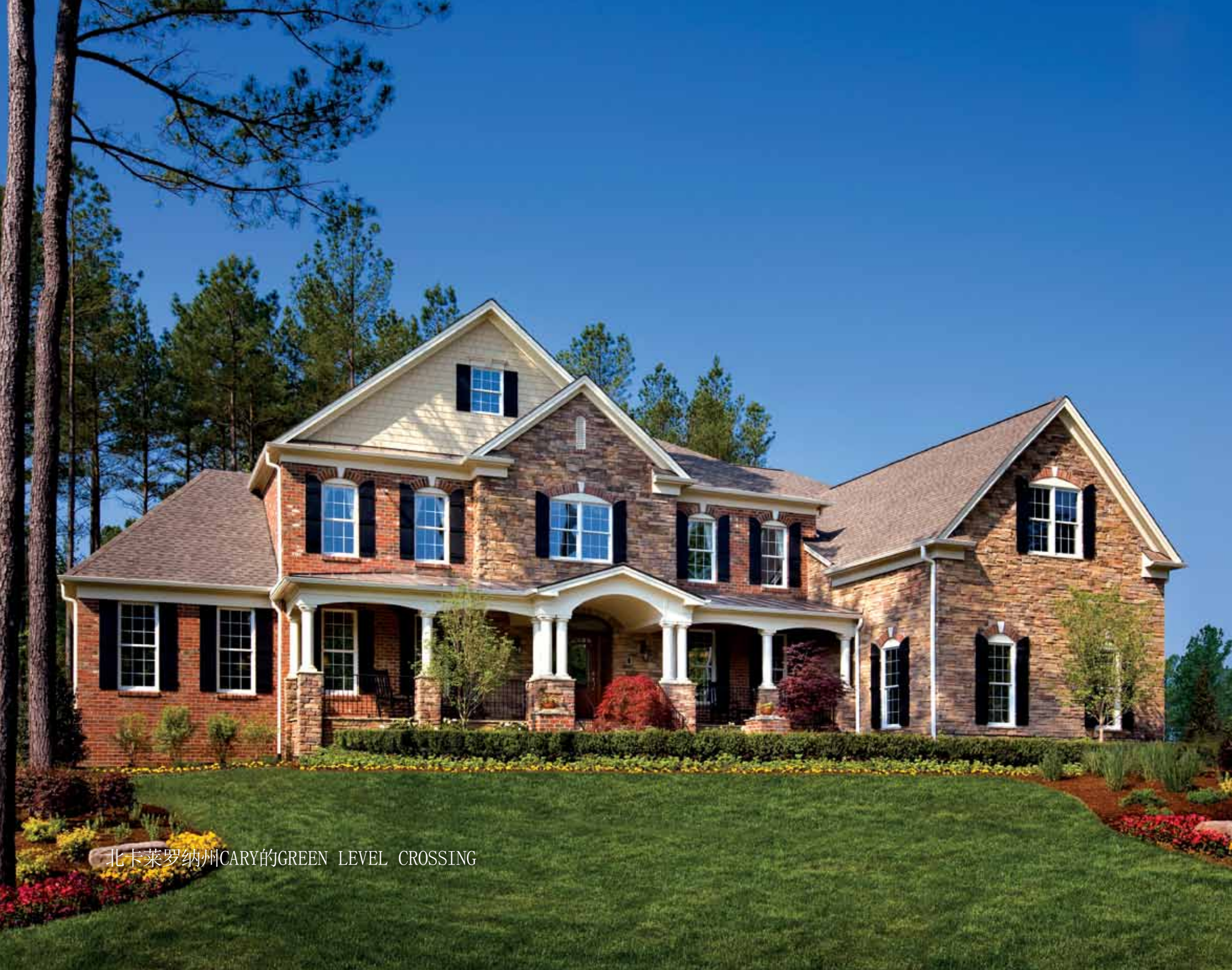
北卡罗纳州CARY的GREEN LEVEL CROSSING