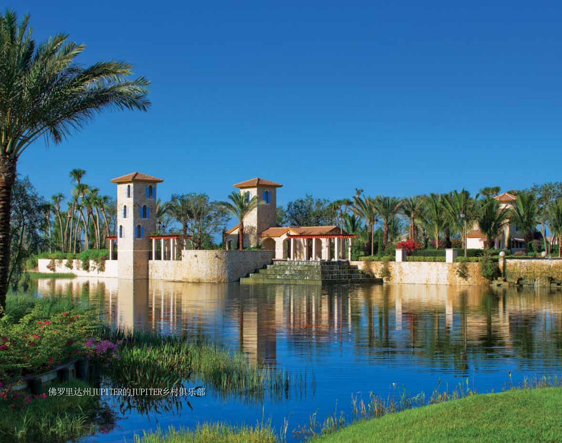
佛罗里达州JUPITER的JUPITER乡村俱乐部