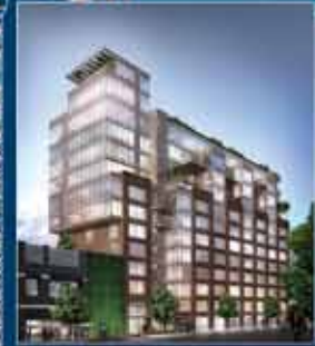
303 EAST 33RD