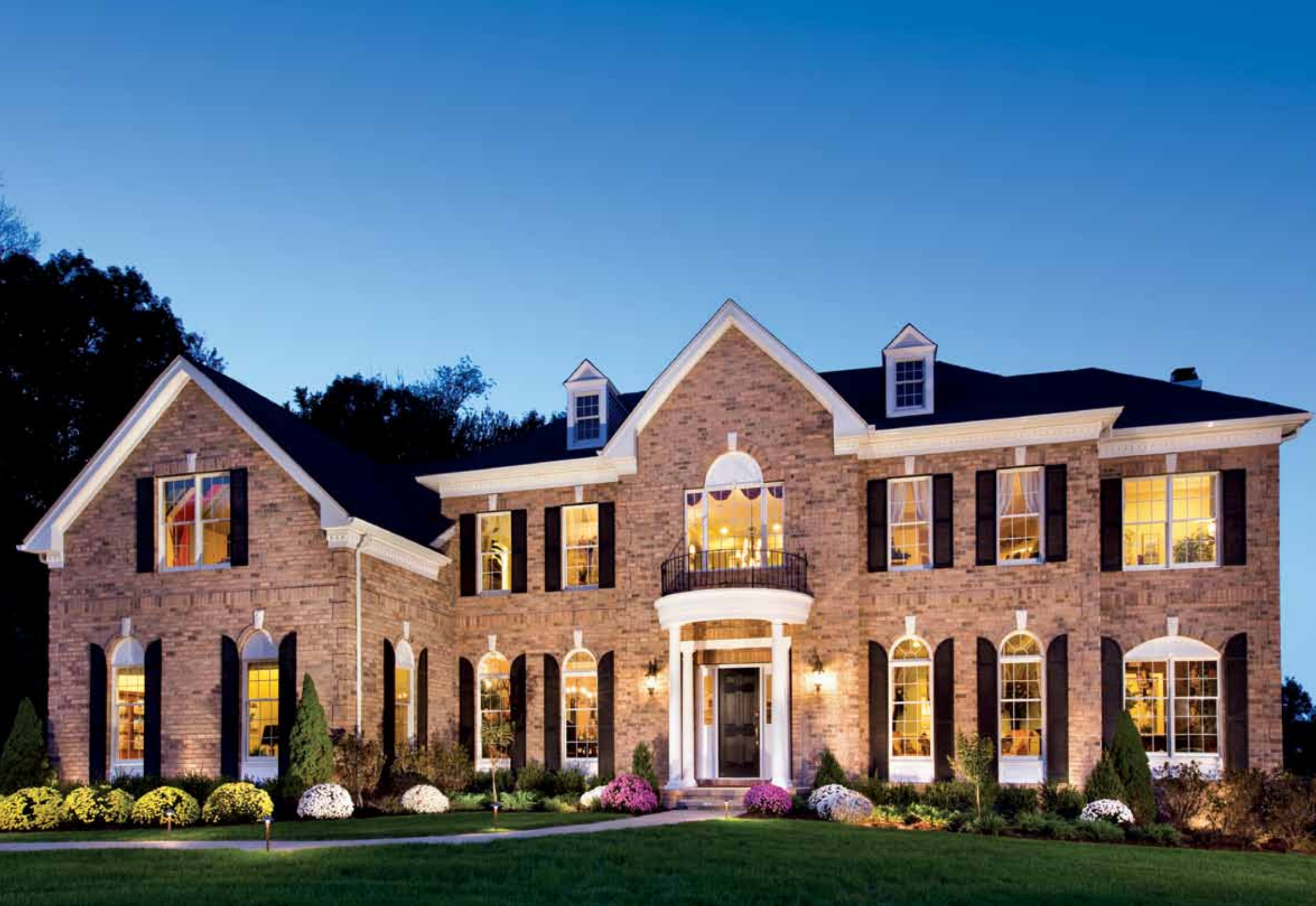
纽约州WAPPINGERS FALLS的OLD HOPEWELL ESTATES