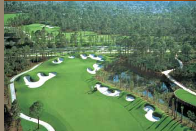
度假村/高尔夫社区