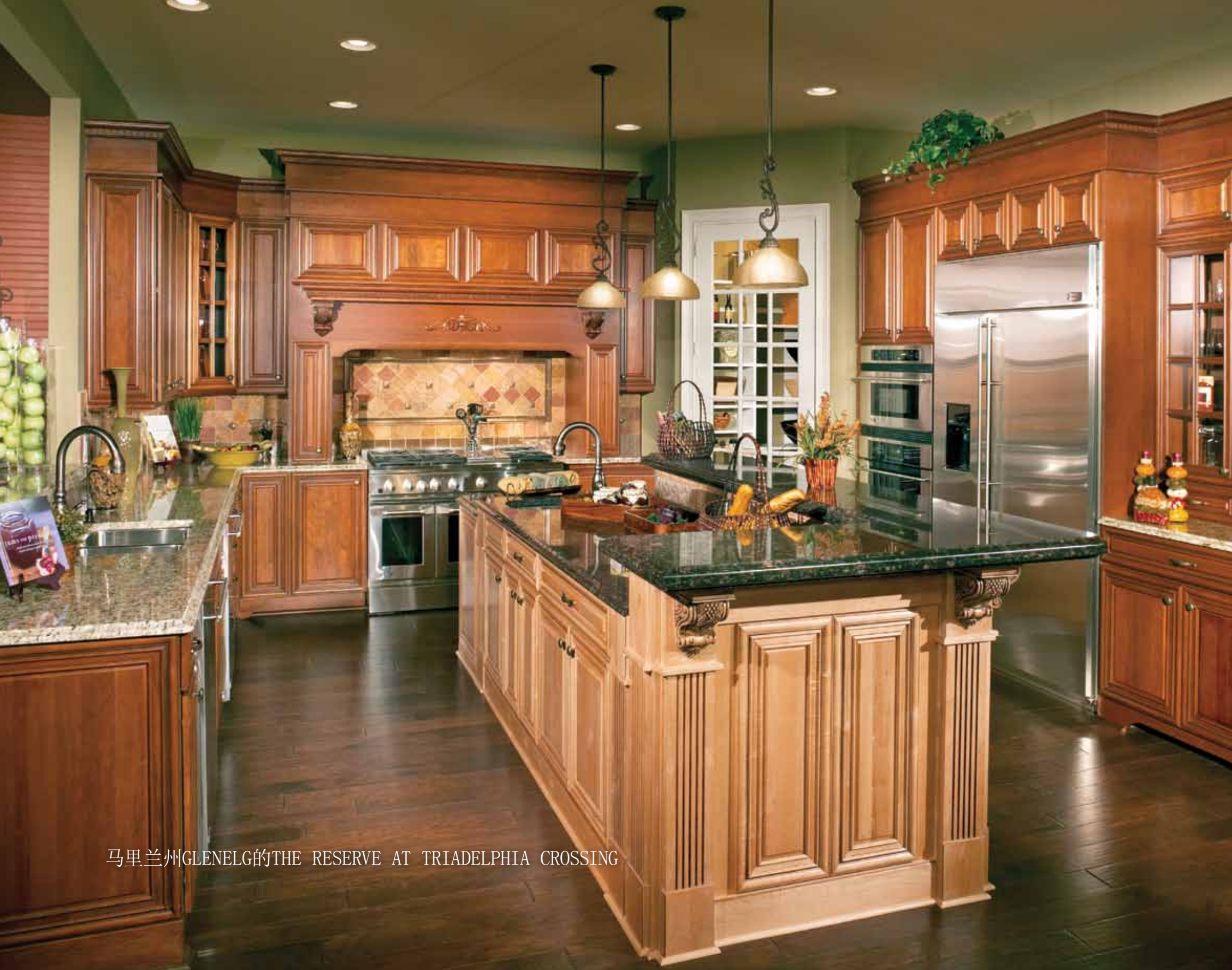
马里兰州GLENELG的THE RESERVE AT TRIADELPHIA CROSSING