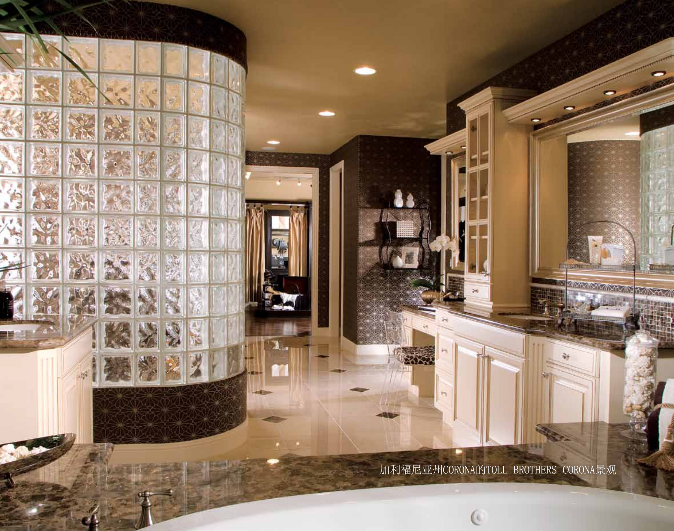
加利福尼亚州CORONA的TOLL BROTHERS CORONA景观