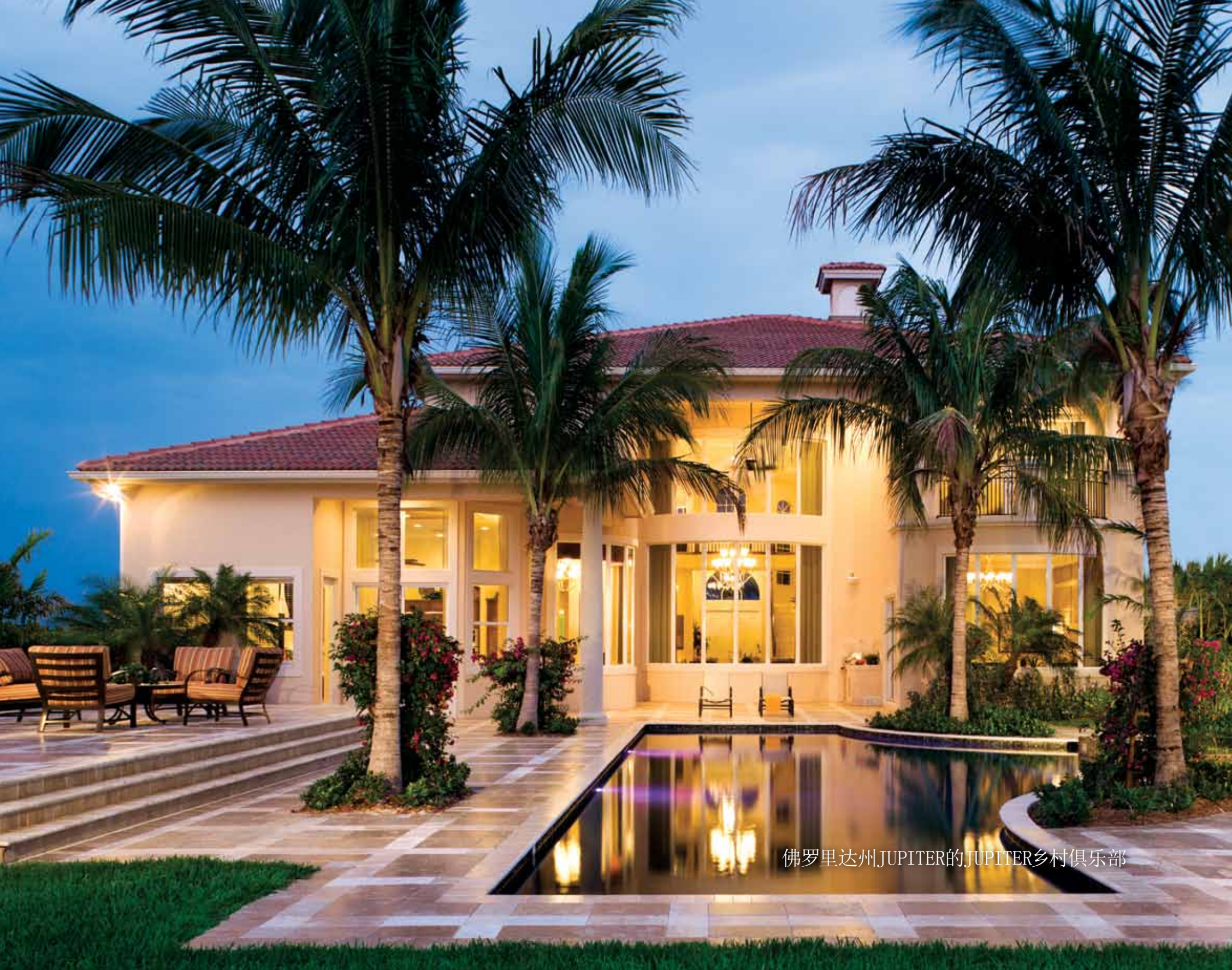
佛罗里达州JUPITER的JUPITER乡村俱乐部