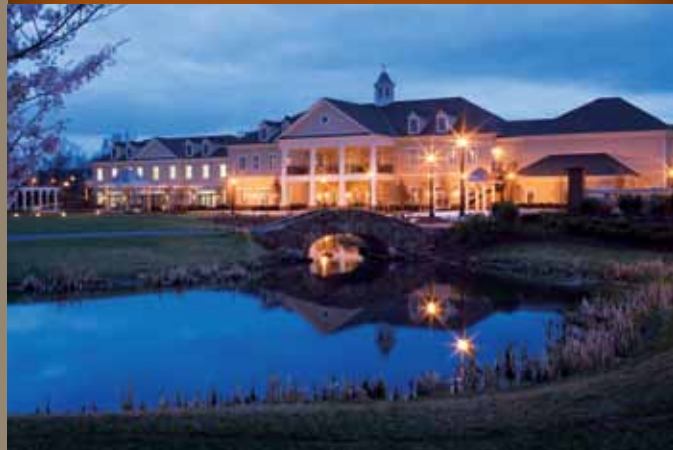
空巢家庭和成人社区住房