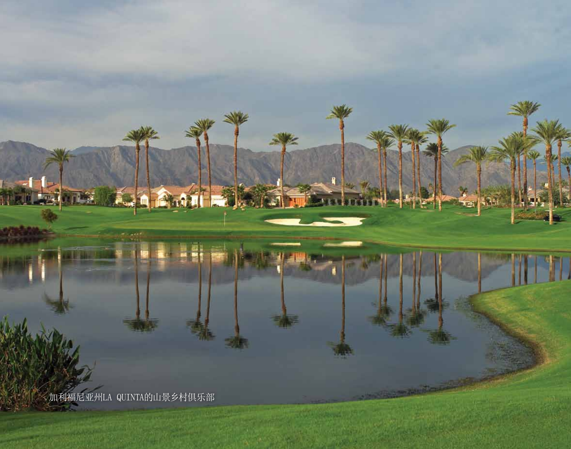
加利福尼亚州LA QUINTA的山景乡村俱乐部