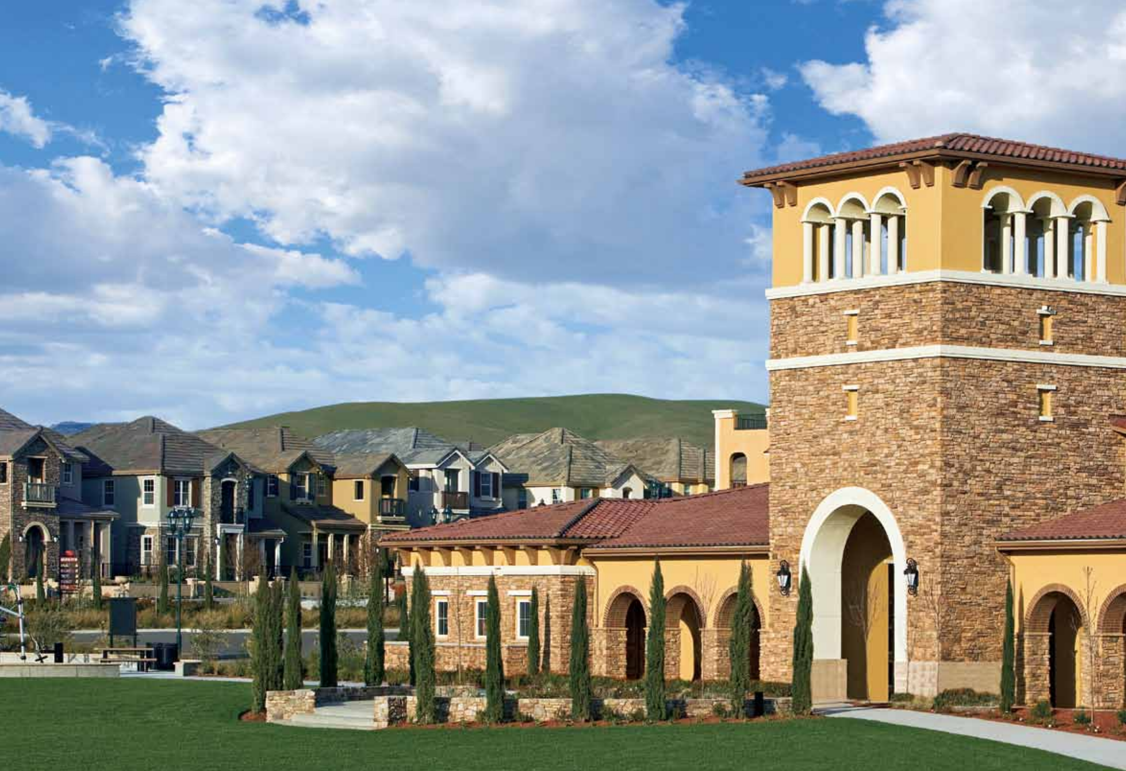
加利福尼亚州DUBLIN的SORRENTO AT DUBLIN BRANCH