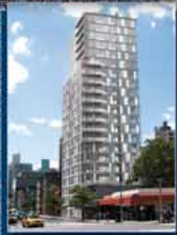
ONE TEN THIRD