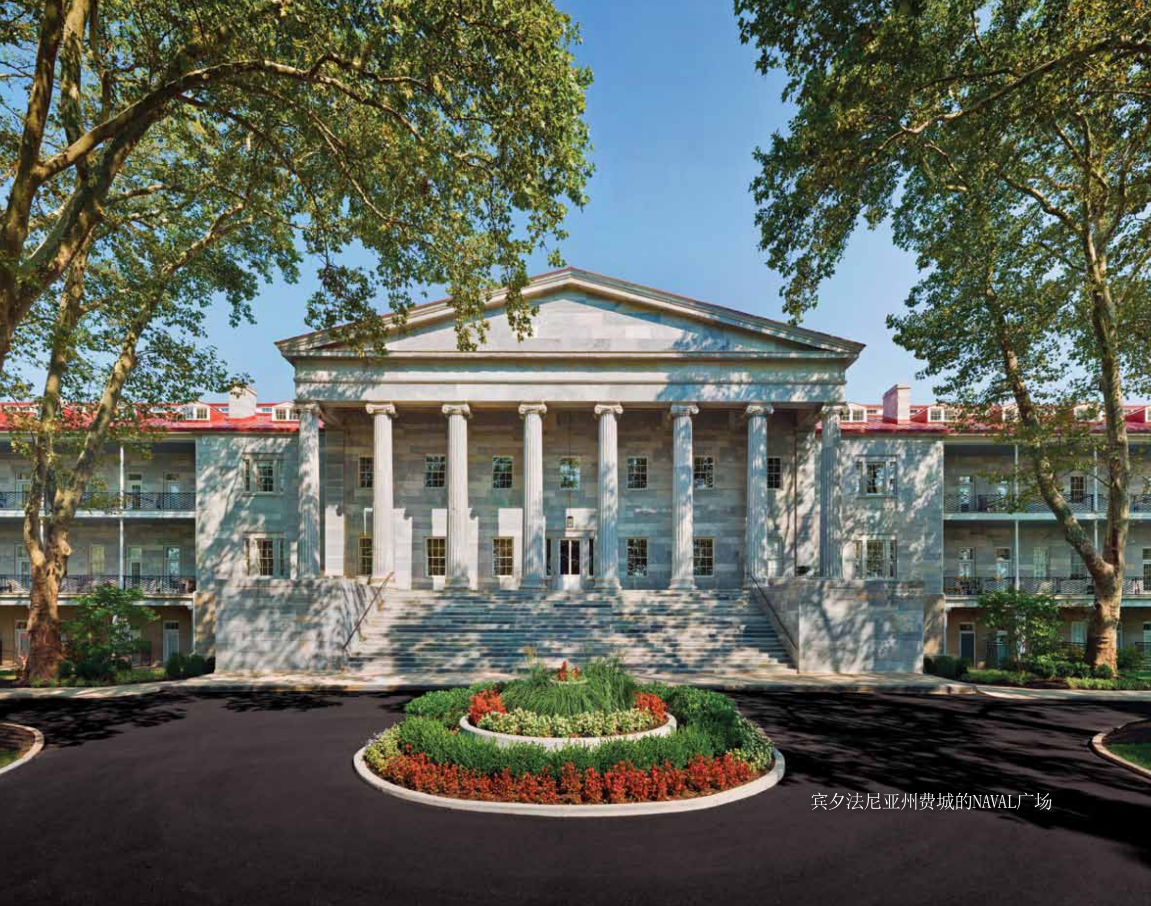
宾夕法尼亚州费城的NAVAL广场