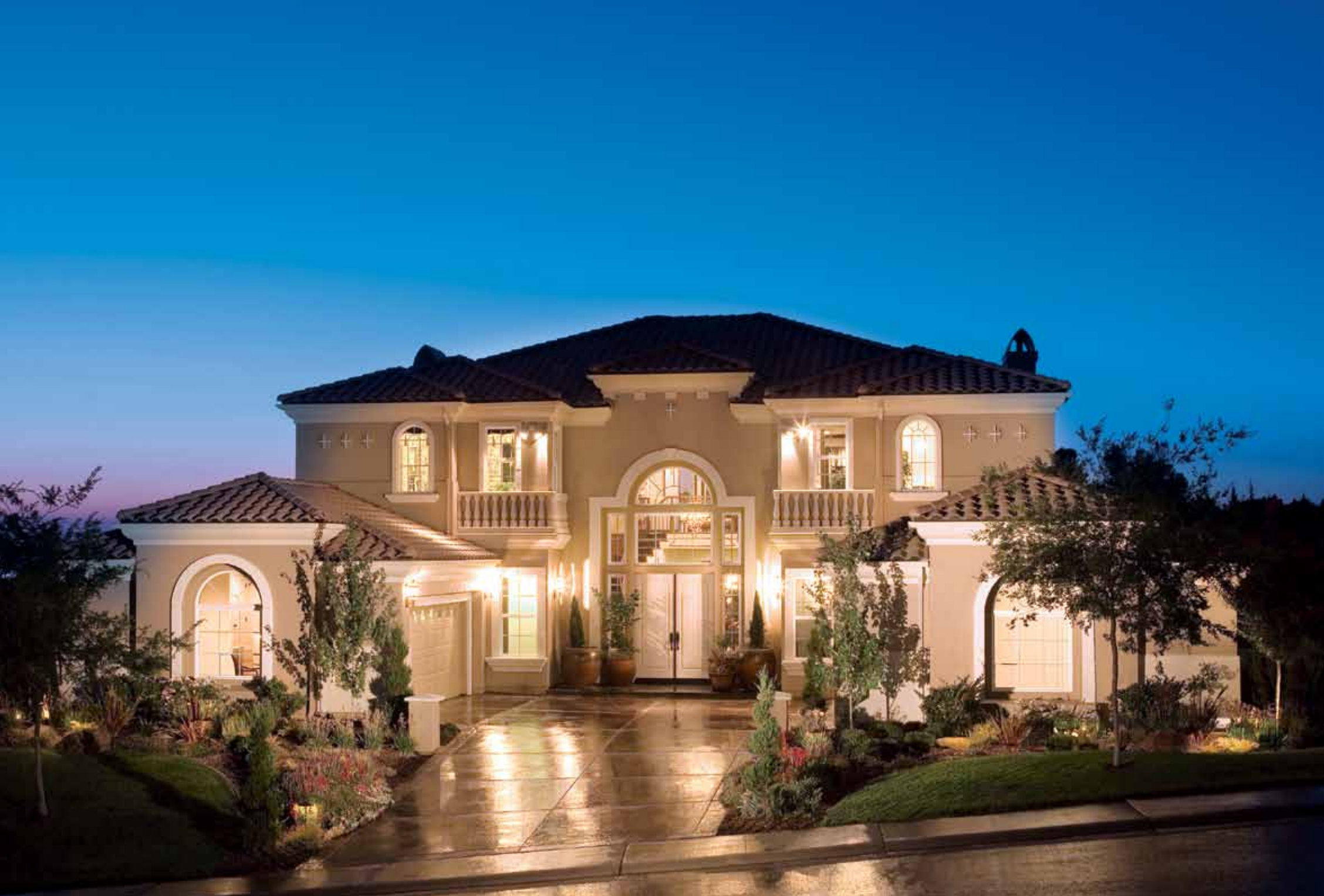
加利福尼亚州EL DORADO HILLS的VILLA LAGO AT THE PROMONTORY