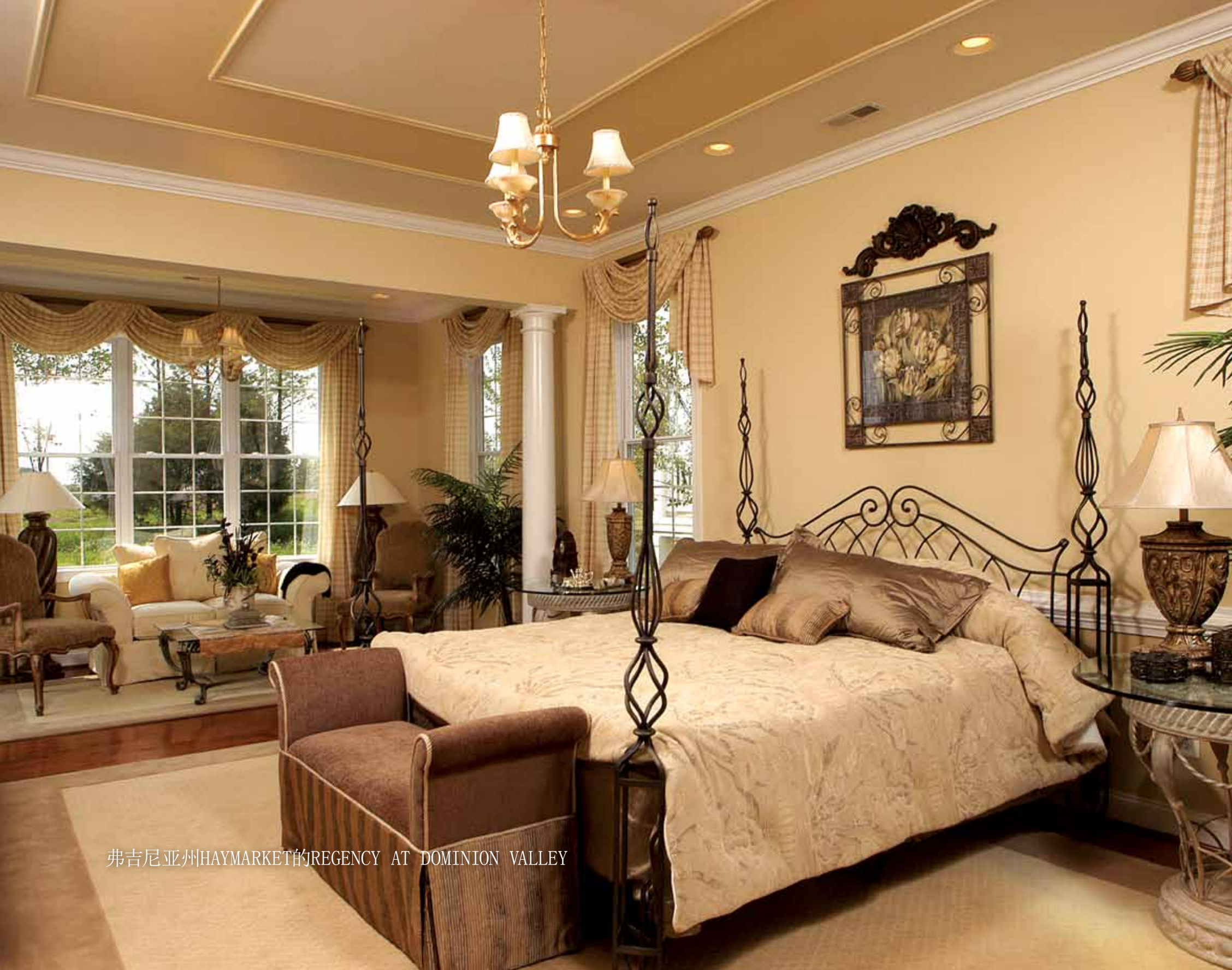
弗吉尼亚州HAYMARKET的REGENCY AT DOMINION VALLEY