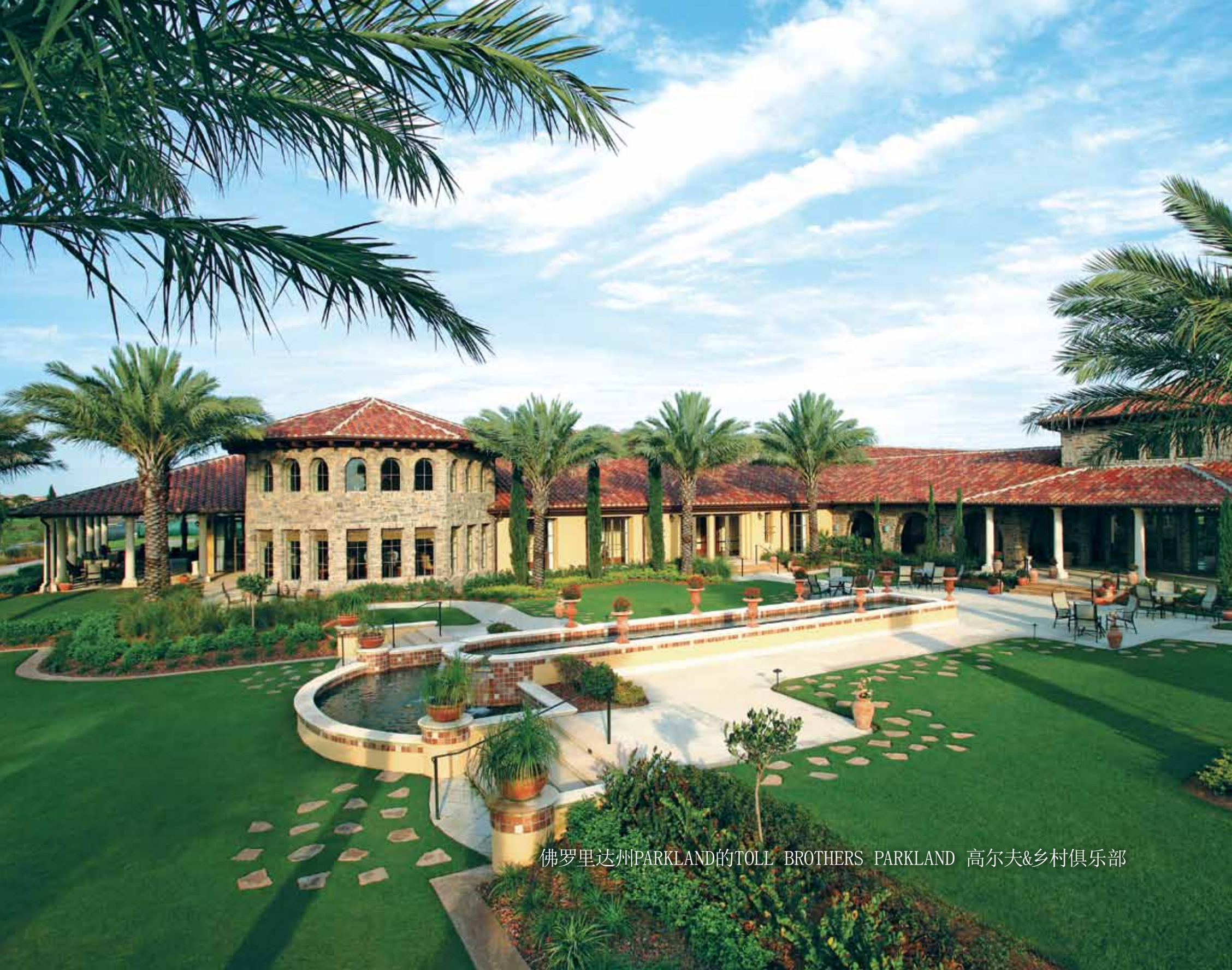
佛罗里达州PARKLAND的TOLL BROTHERS PARKLAND 高尔夫&乡村俱乐部