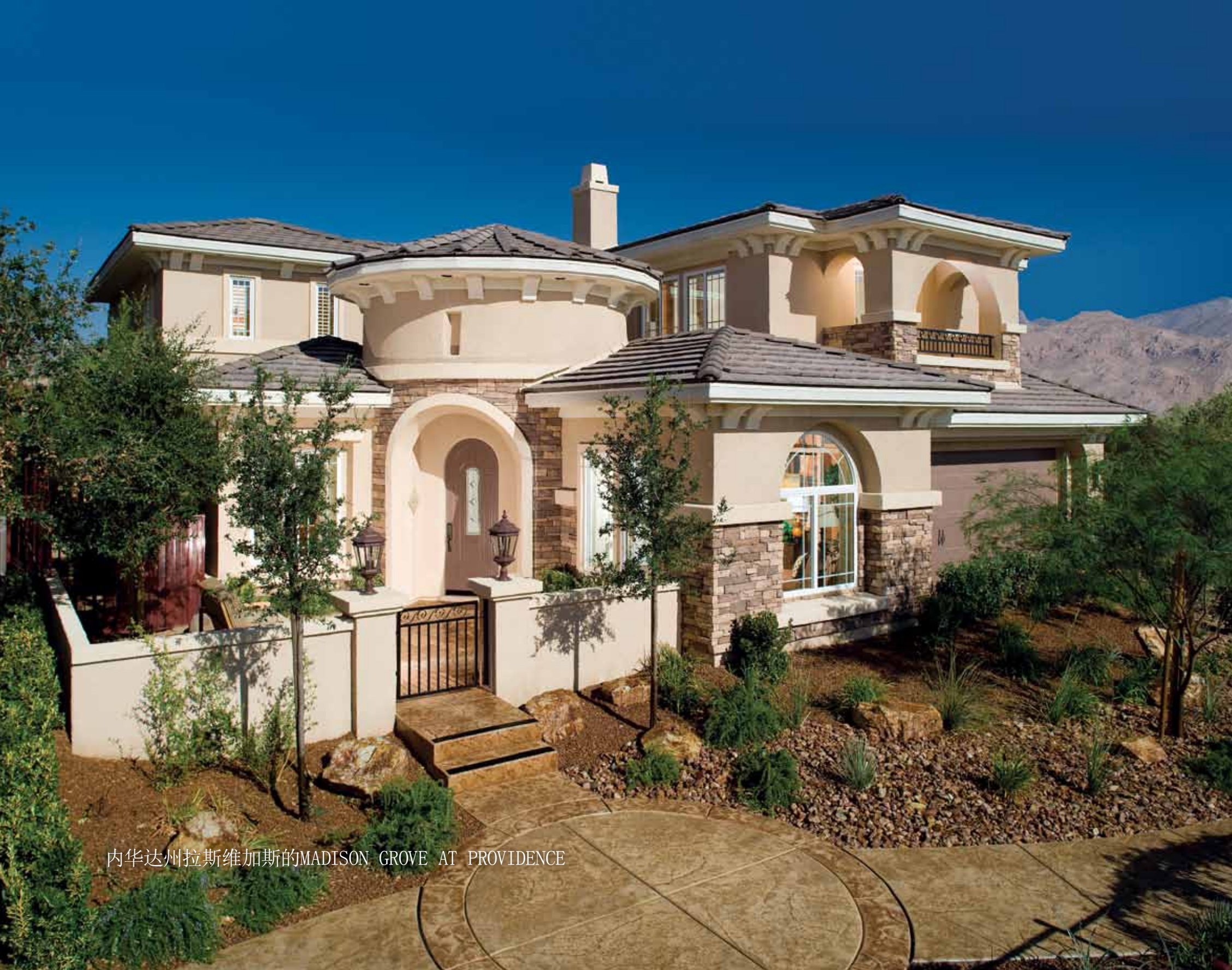
内华达州拉斯维加斯的MADISON GROVE AT PROVIDENCE