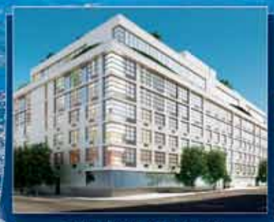
5TH STREET LOFTS